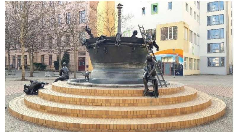
Faunbrunnen in der Leiterstraße