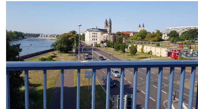
Blick auf die Elbe und den Dom zu Magdeburg