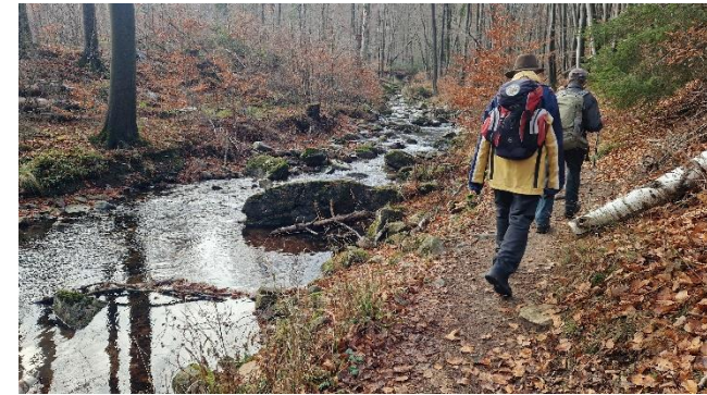
Wanderpfad an der Ilse