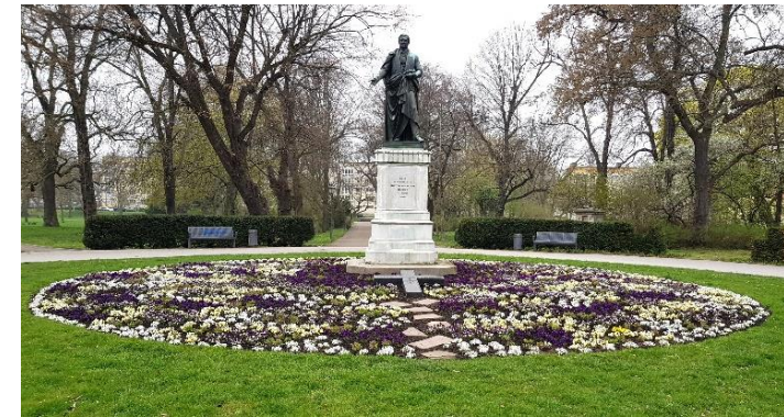
Denkmal des früheren Oberbürgermeisters August Wilhelm Francke