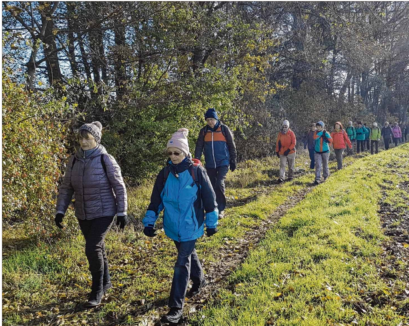
Seit 1994 sind die Mitglieder der Wanderbewegung rund um die Stadt, in Deutschland, aber auch in der halben Welt unterwegs.

Bald kamen Wanderreisen und mit der Aufnahme in den Internationalen Volkssportverband im Jahr 2003 die internationalen Wanderreisen hinzu. Beide sind äußerst beliebt, so dass man mit der Anmeldung schnell sein muss, um einen Platz zu bekommen. Inzwischen waren die Magdeburger