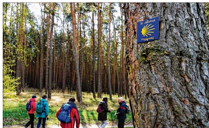
Auch auf dem berühmten Jakobsweg sind die Magdeburger Wanderfreunde unterwegs.

Doch auch die Wanderungen hier in der Region, differenziert nach unterschiedlichen Schwierigkeitsgraden 10, 15 oder 20 km, erfreuen sich täglicher Beliebtheit. Nebenbei bemerkt, ist es selbstverständlich, dass im Zuge des Klimaschutzes nur der umwelt-