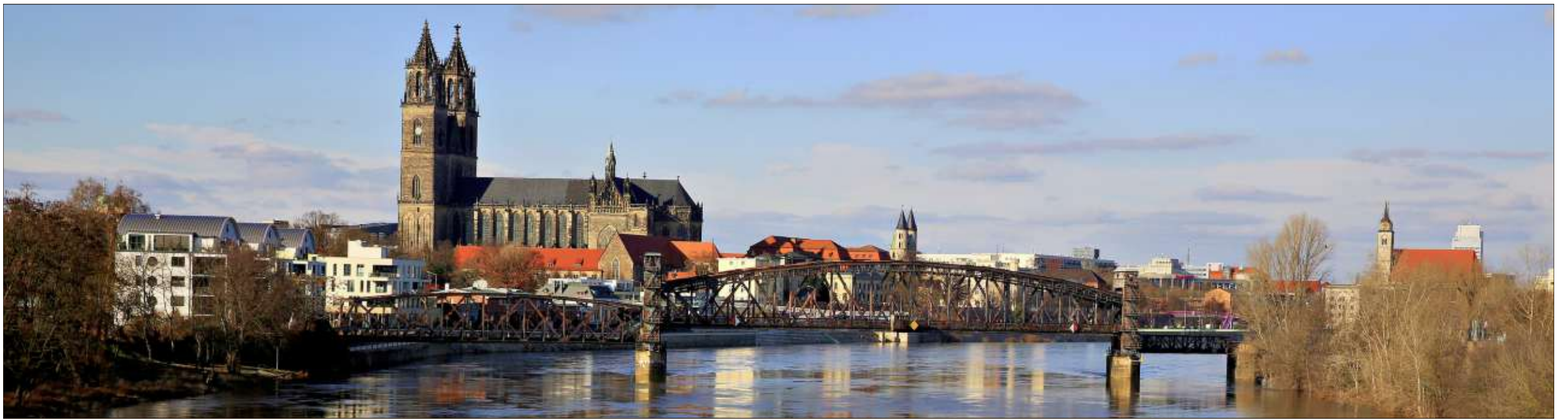
Auch für Magdeburger immer wieder schön: Die Hubbrücke mit Dom und neu bebautem Elbbahnhof. Diese Aussicht gehört zu einem der Panoramen, die bei der Wandertour zu sehen sind.