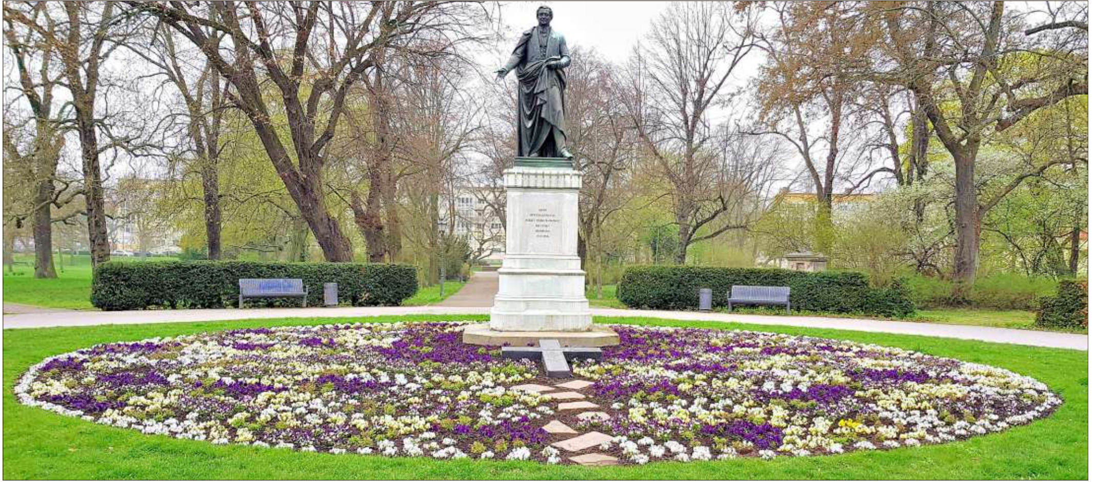
Das Denkmal für August Wilhelm Franke im Nordpark. Der frühere Magdeburger Bürgermeister ist auf der Tour durch die Stadt zu finden.

Marita Uterwedde, Wanderbewegung, Rainer Schweingel, Volksstimme