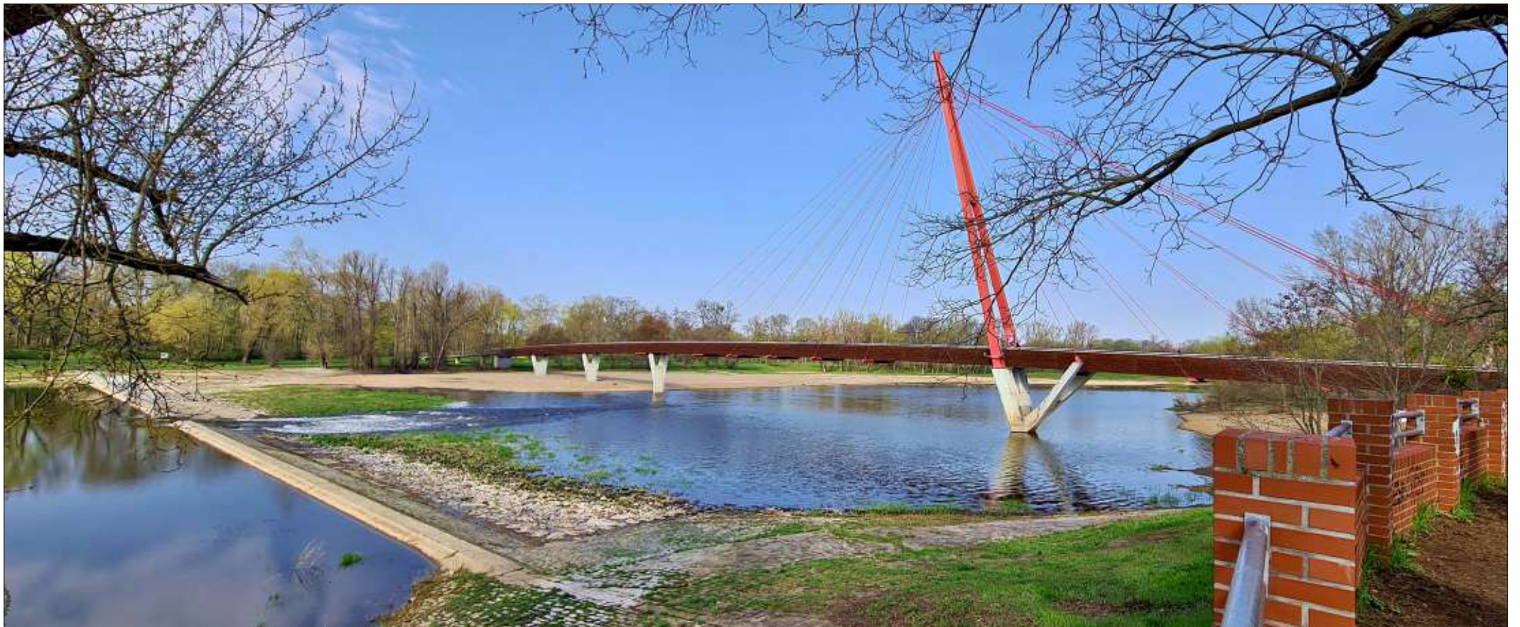
Immer wieder ein Hingucker und jeden Tag auch irgendwie anders: Der Wasserfall in der Alten Elbe – ein Foto- und Rastpunkt auf der Tour von und nach Cracau.

Marita Uterwedde, Wanderbewegung, Rainer Schweingel, Volksstimme