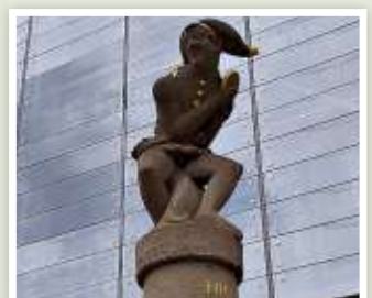
Alter Markt: Till Eulenspiegel auf dem Eulenspiegelbrunnen.

Der Apel-Weg ist markiert (rotes Quadrat auf weißem Hintergrund) und beim Deutschen Volkssportverband gemeldet.