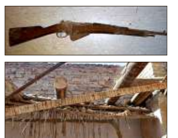
Reste der Zwischendecke (unten), in der das alte Gewehr gefunden wurde; oben das Fundstück.

Von Jana Heute Leipziger Straße • Dielenbretter, morsche Balken, Stroh – und mittendrin ein altes Gewehr: Betagte Häuser haben es ja oft in sich, mit einem solchen Fund im Fußboden hatte der Bauarbeiter aber trotzdem nicht gerechnet. Bei Abrissarbeiten für ein Gebäude in der Grusonstraße förderte ein alter Dielenboden im Obergeschoss eines Gebäudes gestern gegen 10 Uhr