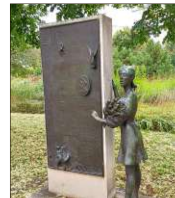
Reuterallee: Erinnerung an die Rettungstat eines sowjetischen Offiziers, der 1969 ein aus dem Fenster fallendes Mädchen auffing.