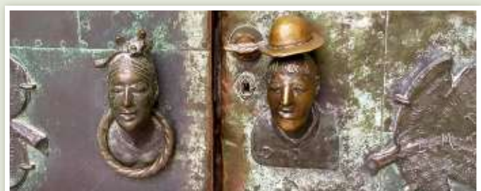
Kloster: Wer in Magdeburgs Kunstmuseum will, muss ein Werk von Heinrich Apel drücken. Blick auf die von ihm gestaltete Klinke.

Herausgekommen ist eine elf Kilometer lange Stadtwanderung. Drei Kunstwerke mussten bei der Route ausgelassen werden, weil sie zu abgelegen liegen