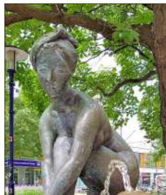
Breiter Weg: „Die Badende“ von Apel schmückt eine historische Badewanne, die einst am Domplatz gefunden wurde.

Große Teile seiner privaten Sammlung sind im Schloss Hundisburg bei Haldensleben zu sehen, darunter 100 Zeichnungen, Ölbilder und Grafiken sowie 80 Plastiken und Medaillen.