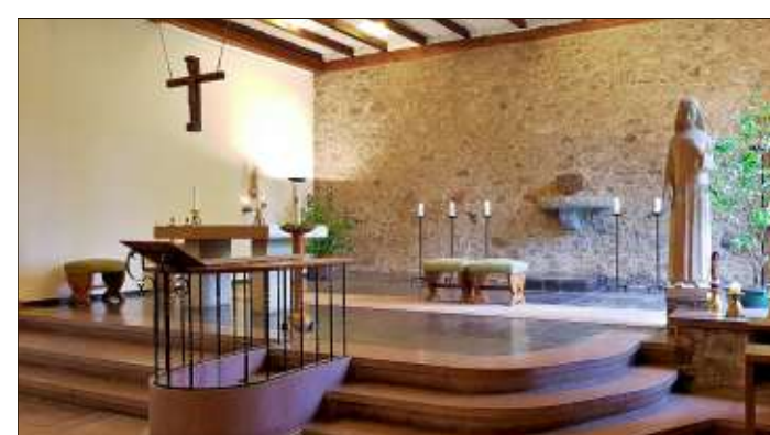
Colbitz: Sehenswert, die Kirche St. Nikolaus von der Flue

Die Wanderwege wurden von Klaus E. Beyer konzipiert. Auskünfte können direkt bei ihm unter Telefon 0391/723 63 34 oder E-Mail unter beyerwan@web.de eingeholt werden. Eine ausführliche Wegbeschreibung und .gpx-Datei gibt es auch auf https://wandernmagdeburg.de/wanderzyklen-2/