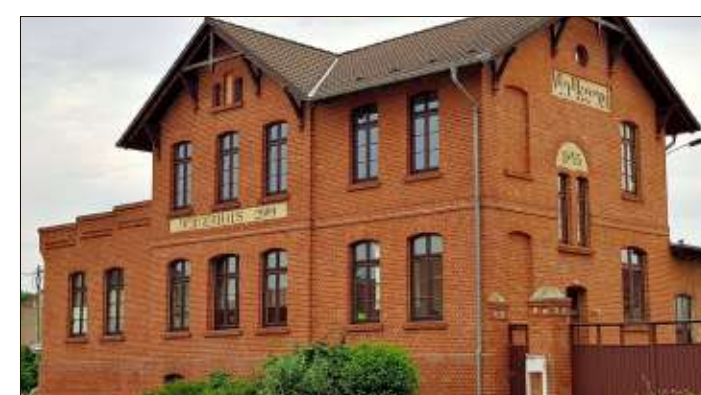
Samswegen: Die alte Molkerei