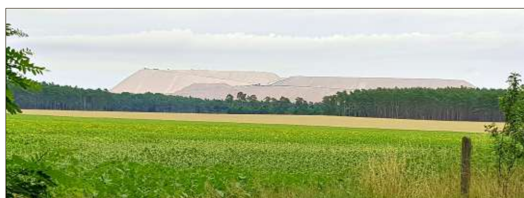
Zielitz: Markenzeichen sind die Kaliberge, genannt Kalimandscharo