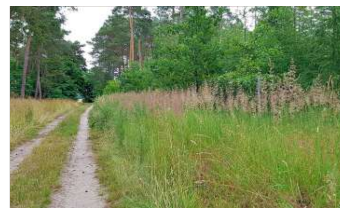
Mitteldrin: Teils auf Waldwegen geht es Richtung Ziel.

Tour 3: Von Groß Ammensleben über Colbitz nach Zielitz