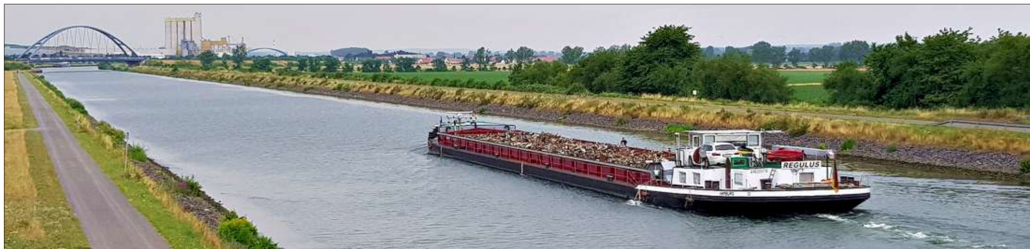
Groß Ammensleben: Kurz nach dem Start geht es über den Mittellandkanal mit einem Blick in Richtung Vahldorf.

Redaktion der Serie: Marita Uterwedde, Wanderbewegung, Rainer Schweingel, Volksstimme