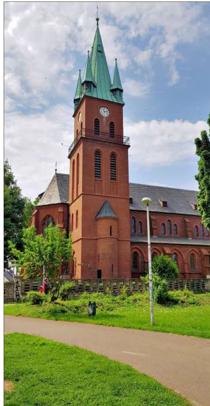
Maria Hilf: Eine der Kirchen in Ottersleben.