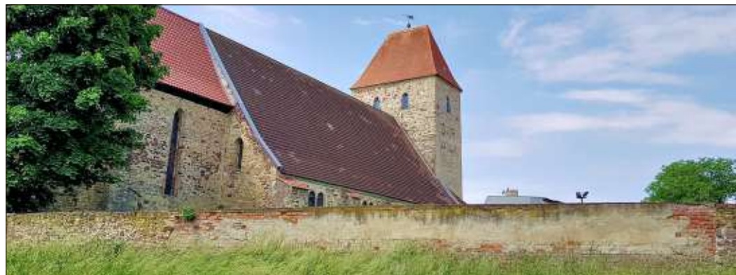
St. Stephanie: Sie ist dem Heiligen Stephanus gewidmet, ein Märtyrer des Christintums.