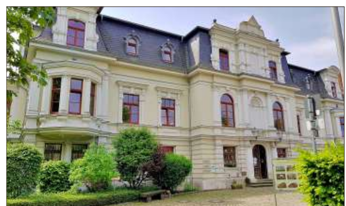
Böckelmannsche Villa: Ein Bildungszentrum in Ottersleben.