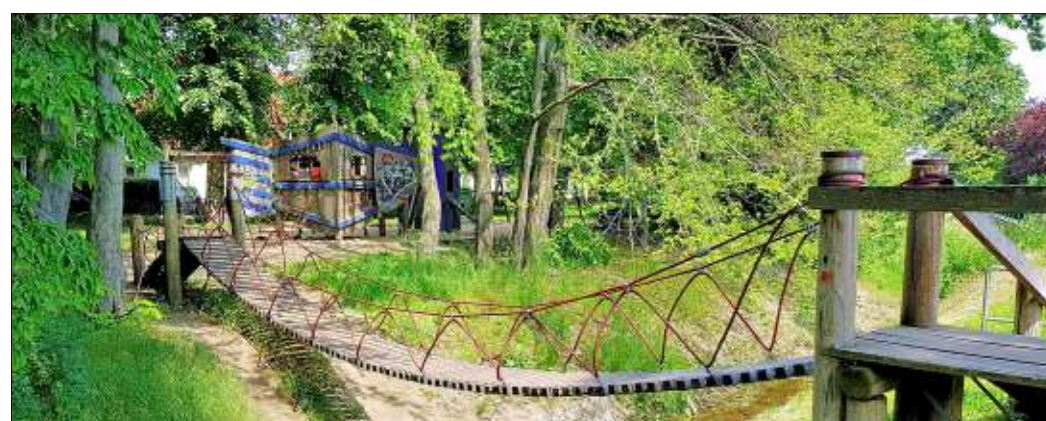
Schrote: Direkt an der Schrote in Stadtfeld-West findet sich diese Hängebrücke.