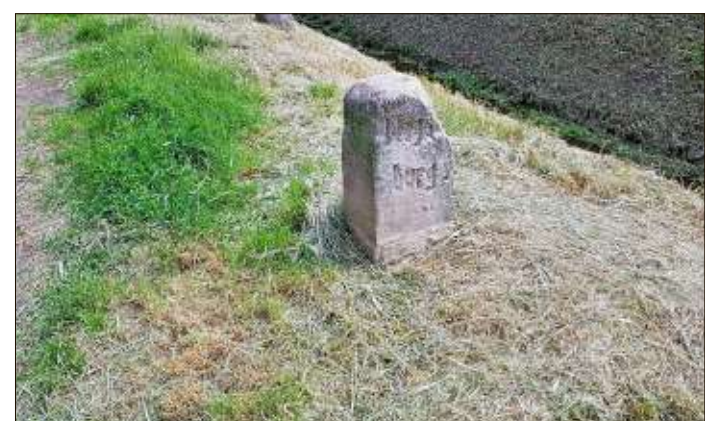
Wegmarke: Am Rande der Schrote entdeckt.